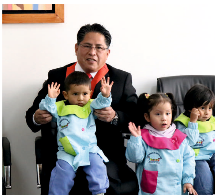
Niños del Wawa Wasi – Mi Angelito Judicial

de Acceso a la Justicia de personas en condición de Vulnerabilidad y Justicia en tu Comunidad, bajo la coordinación.